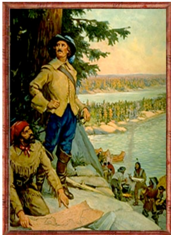
La Vérendrye au lac des Bois

Les opérations de La Vérendrye se révèlent dévastatrices au niveau financier et au niveau de sa santé. Sujet de jalousie, La Vérendrye garde le soutien du gouverneur Beauharnois qui le nomme capitaine de sa garde personnelle. Juste avant sa mort en 1749 et alors qu'il se prépare à repartir vers la mer de l'Ouest il reçoit la Croix de Saint Louis, la plus haute distinction de l'époque.