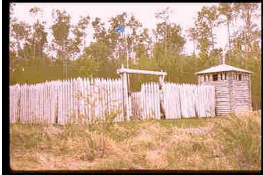
Fort St Charles

http://www.mef.gc.ca/images/FortSaint-Charles.jpg