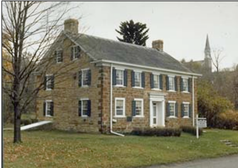
Maison Faribault à Mendota

A quelques rues de la maison de Jean-Baptiste Faribault s'élève l'église catholique St Pierre qui est la plus ancienne église du Minnesota restée en service au fil de temps et qui propose toujours des services religieux.